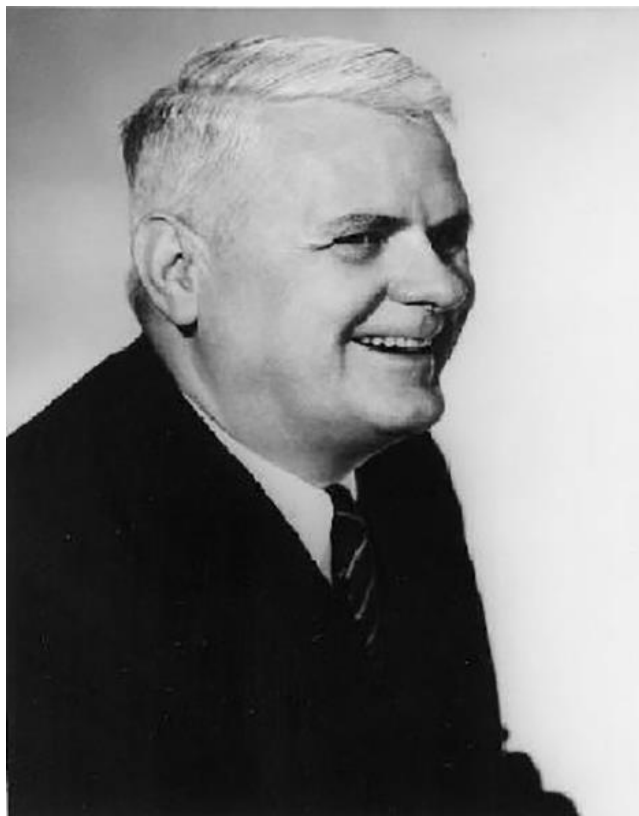
Alonzo Church Lambda Calculus