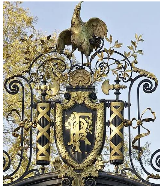
高卢雄鸡：法国的象征